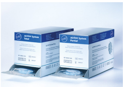
ディスペンサーボックス (単位: 10枚入/箱)