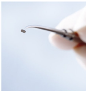
フットプレート用サイザーの 測定ヘッド