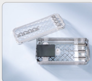
軟骨パンチ（インスツルメントトレー入）

KURZ 軟骨パンチは、術中に小さな楕円形の軟骨スライスを、迅速かつワンステップで作成することを可能にします。中央の穿孔は、円形の中空ステムを持つKURZ中耳用プロセスTORPを対象としています。